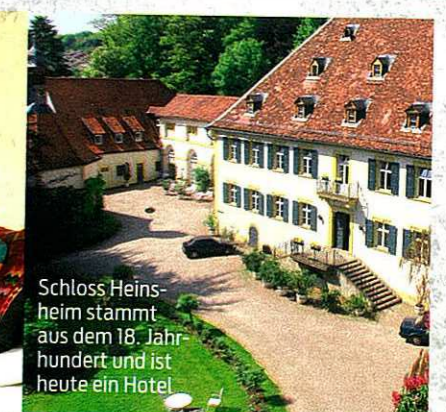
Schloss Heinsheim stammt aus dem 18. Jahrhundert und ist heute ein Hotel

Schiller, Wieland, Hölderlin: Scheinbar wird man im Neckartal – wie hier bei Besigheim – automatisch zum Dichter