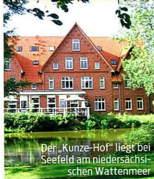
Der „Kunze-Hof“ liegt bei Seefeld am niedersächsischen Wattenmeer

Die Woche auf dem „Kunze-Hof“ an der Nordseeküste war Entspannung pur. Inmitten eines weitläufigen Parks mit alten Bäumen und Badesee lernte ich jeden Tag neue Facetten meiner Stimme kennen. Unsere Gruppe machte Atem- und Gesangsübungen, meditierte und ließ sich am Wattenmeer den Wind um die Nase wehen. Wir begannen mit einfachen Mantras – am Ende des Kurses sangen wir sogar mehrstimmig im Chor. Seitdem ist der Gesang ein fester Bestandteil meines Lebens. 6 Übernachtungen mit Vollpension vom 3. bis 10. oder 10. bis 17. August ab 775 Euro/Person. Buchung über www.skr.de , mehr Infos: www.kunze-hof.de